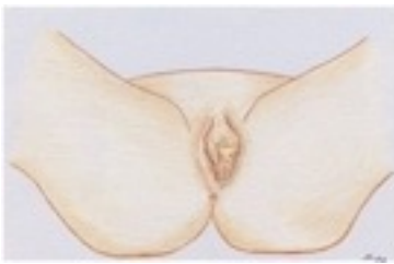
Fig. 1 - Grave ipertrofia delle piccole labbra

L'intervento chirurgico maggiormente utilizzato ha una durata di circa 1 ora, è semplice, risolutivo e di grande soddisfazione per le pazienti. Può essere eseguito in anestesia locale con sedazione, in anestesia regionale-periferica oppure in anestesia generale, e le donne non hanno particolare fastidio post-operatorio anche in considerazione del fatto che i piccoli punti di sutura applicati non devono essere neanche rimossi. Il giorno dopo l'intervento la paziente può riprendere l'attività lavorativa e può tornare alla completa normalità in circa 3 settimane.