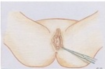
Fig. 3 - Asportazione chirurgica